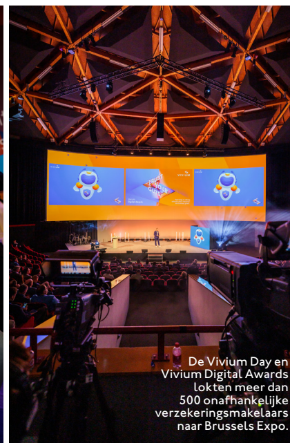
De Vivium Day en Vivium Digital Awards lokten meer dan 500 onafhankelijke verzekeringsmakelaars naar Brussels Expo.