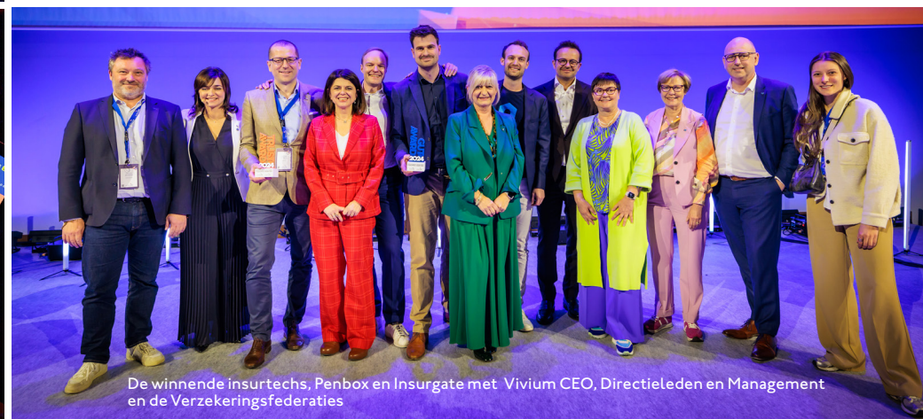
De winnende insurtechs, Penbox en Insurgate met Vivium CEO, Directieleden en Management en de Verzekeringsfederaties